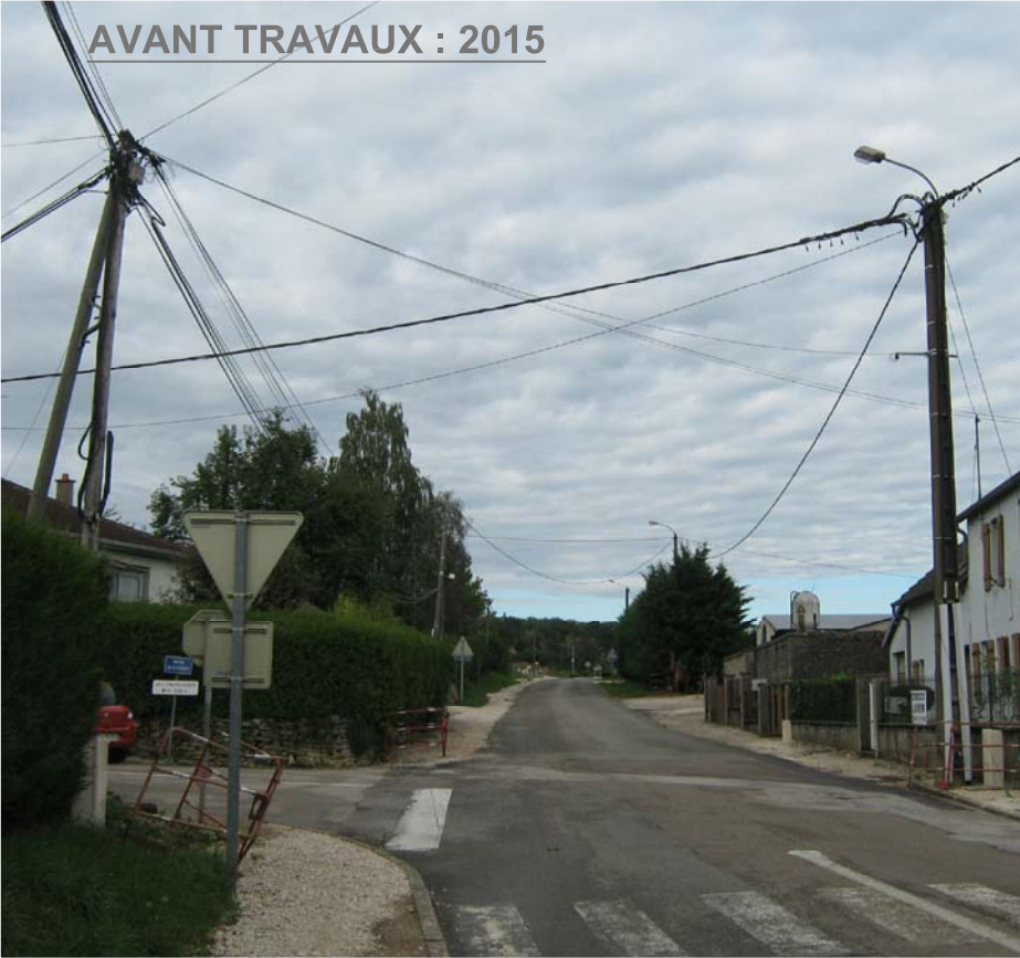
AVANT TRAVAUX : 2015